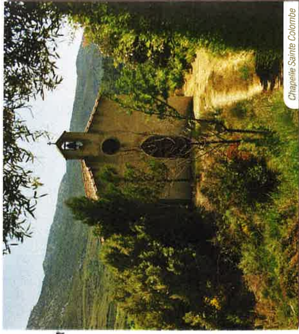
Chapelle Sainte Colombe