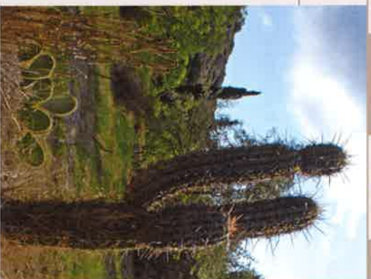
DANS LE JARDIN BOTANIQUE DE FONTCAUDE

À sud du pays de la Narbonnaise, à l'abri-chemin entre les Corbières et la mer, Feuilla dispose d'un véritable « éden » pour les amateurs de botanique. Le climat bien particulier a permis de faire pousser quantité de plantes grasses. La collection de Dominique Jalabert, à découvrir le long des sentiers botaniques de Fontcaude, n'en compte pas moins de 2 000 (visite sur rendez-vous) ! La qualité et la conservation de ces espèces ont valu à cette collection d'être classée parmi les 50 plus beaux jardins de cactées et de succulentes de France par l'Association internationale des amateurs de plantes succulentes (AIAPS) du Jardin exotique de Monaco.