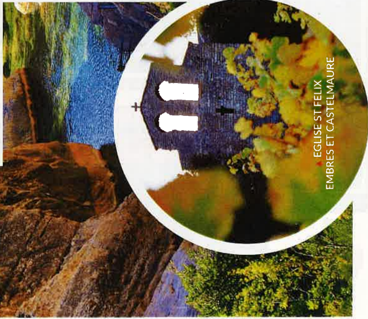
▲ EGLISE ST FELIX EMBRES ET CASTELMAURE