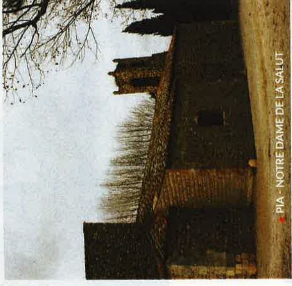
▲ PIA - NOTRE DAME DE LA SALUT

Débutez ce voyage par le village de Pia avec un lieu de loisirs incontournable : Notre Dame de la Salut, dans le hameau d'Ortolanes. Anciennement dédiée au thaumaturge saint Saturnin, elle daterait pour ses parties les plus anciennes, du XIIe siècle.