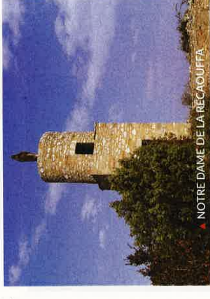
▲ NOTRE DAME DE LA RECAOUFFA

Direction VILLENEUVE DES CORBIÈRES , et visitez l'église St Sernin du XVIIe siècle. A l'indication du lieu de pèlerinage de Notre Dame de la Récaouffa, empruntez cette portion ombragée du Sentier Cathare, pour profiter du panorama.