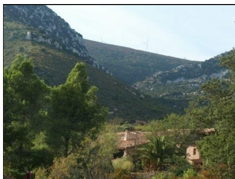
Planal de Saint Roch 11350 TUCHAN