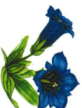
GHANTIANE DE KOCH / DESSIN N.L.

DIFFICULTÉS • entre 3 et 4 : montée raide et glissante • zone de chasse (se renseigner en mairie)